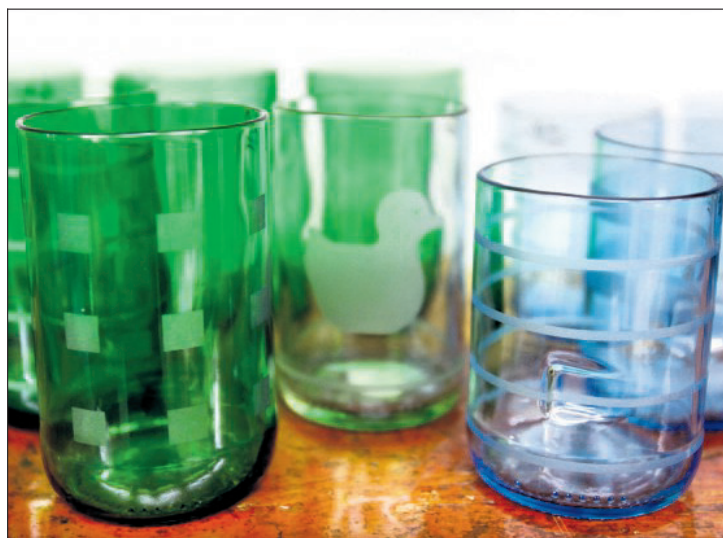
Drikkeglass laget av avkuttete glassflasker uten pant.

Det stilles strenge krav til varene i butikken Konsumhelden. Alt skal være regionalt produsert og resirkulert.