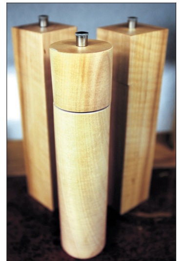
Krydderbøsser laget av trær som har falt ned i Berlin.