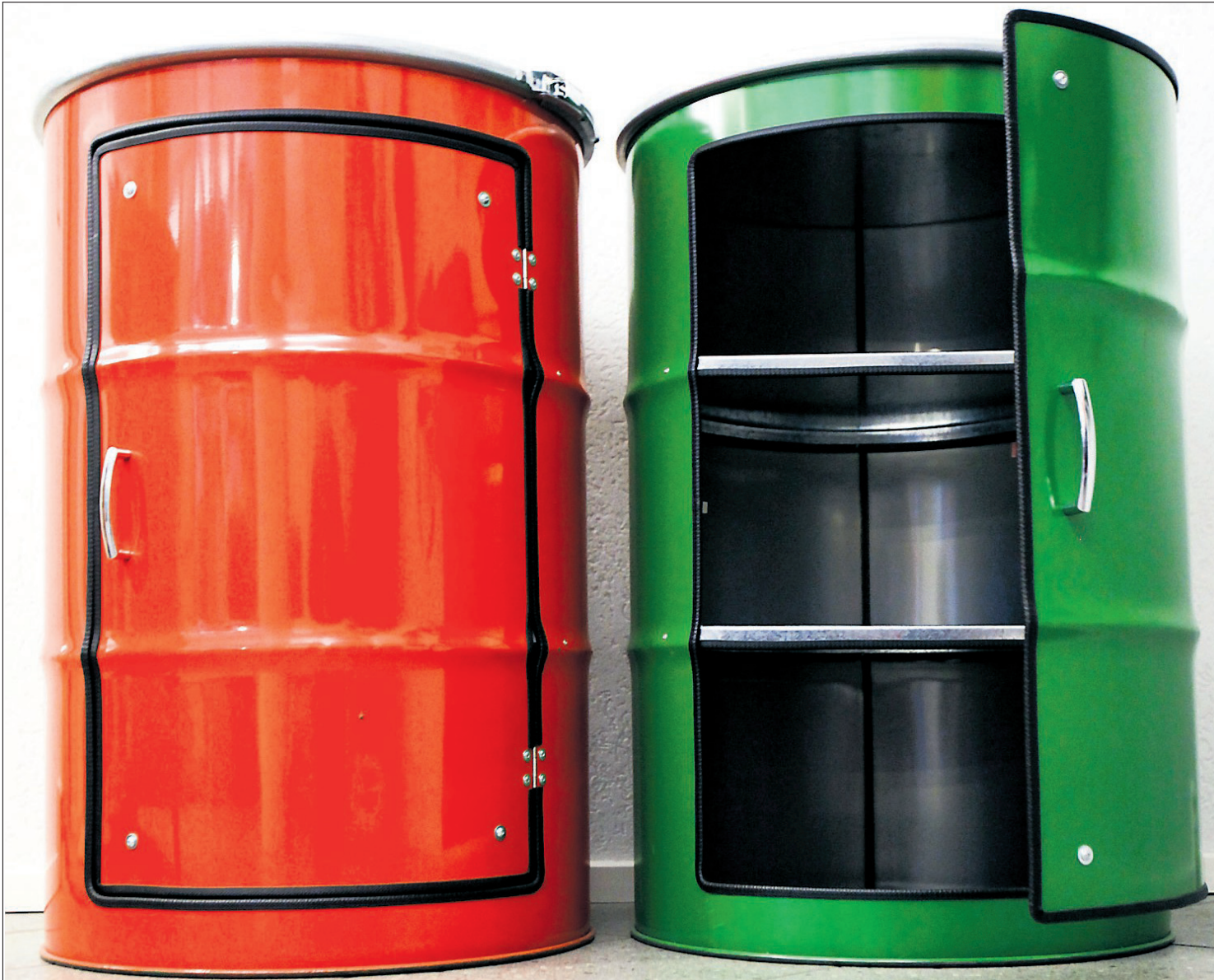
Skapene er laget av oljetønner. Med jevne mellomrom testes slike tønner, og de som lekker, kastes – eller de blir til skap på bedriften Lockengelöt i Hamburg. Tønneskapene kan tilpasses individuelt, for eksempel for stereoanlegg, og de er så solide at man kan danse på dem. To kan også settes oppå hverandre.